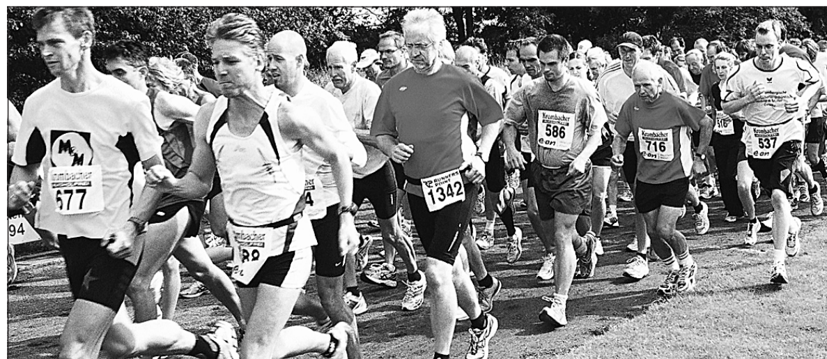
Der Start über 10 Kilometer beim 26. Salzkottener Hederaufenlauf.