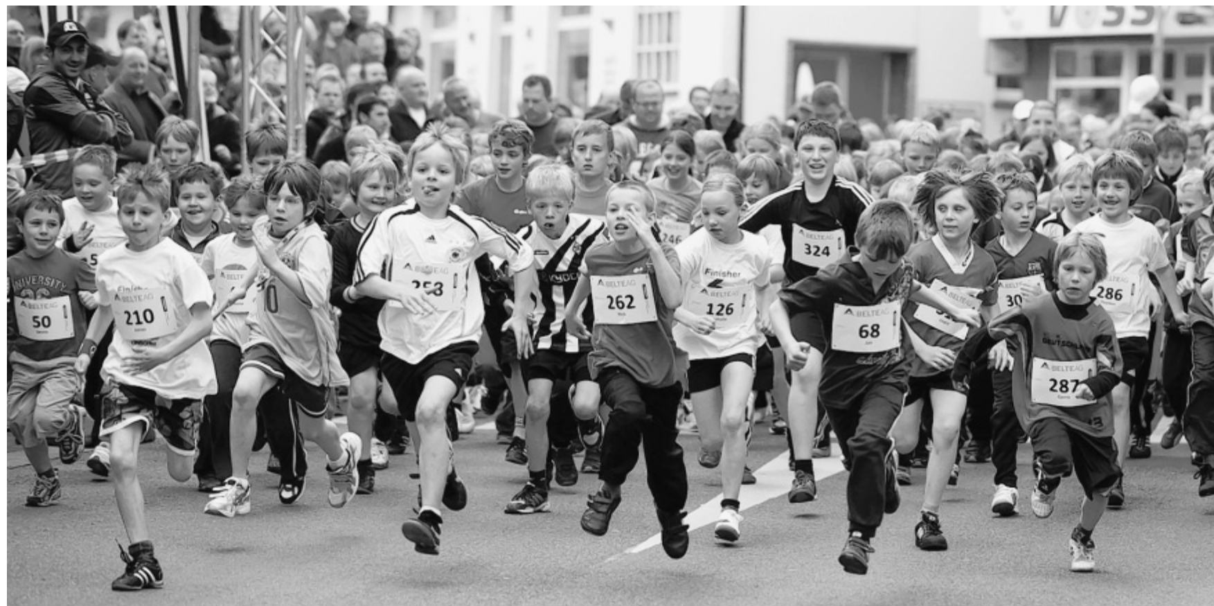
Auf die Plätze, fertig, los: In der City ging am Samstag der erste Teil des Delbrücker Kinder- und Jugend-Marathons über die Bühne. Auf den ersten der insgesamt 3.000 Meter wurde mächtig Dampf gemacht. Vom heutigen Montag an wird in den Ortsteilen täglich weitergelaufen.